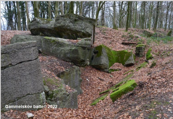
Gammelskov batteri 2022

Efter Genforeningen sprængte den danske hær de fleste af anlæggene. Mange steder ligger de sprængte rester dog stadig tilbage og vidner om en dramatisk tid.