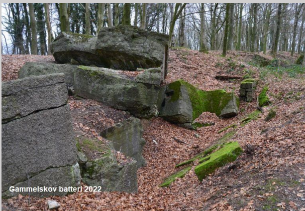
Gammelskov batteri 2022

Na de Hereniging met het zuiden van Denemarken blies het Deense leger de meeste installaties op. Op vele plaatsen zijn echter nog steeds overblijfselen bewaard gebleven, die vandaag getuigen van een dramatische tijd.