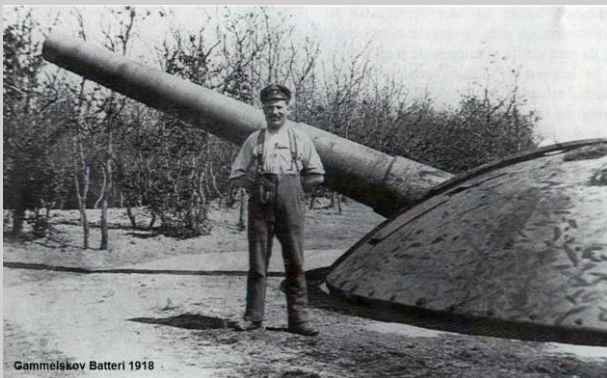
Gammelskov Batteri 1918

Er werden meer dan 900 verschillende installaties gebouwd, van de 24 cm kanonnen in het uiterste zuiden tot de lichtere batterijen in het midden van de linie. Meest naar het noorden bevonden zich de vele bemannings- en flankerende bunkers, die achter de loopgraven en de vele kilometers prikkeldraadversperring geplaatst waren.